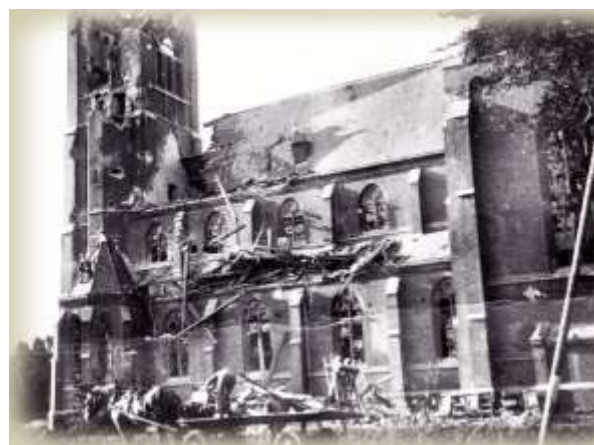
Info: heemkunde Reusel

Als EHBO-vereniging werken we graag mee om deze herdenking te laten slagen. Onze vrijheid hebben we danken aan de personen die hiervoor hebben gevochten.